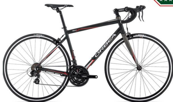
Bicicleta Speed Orbea Avant H70