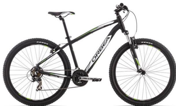
Bicicleta MTB Orbea All-Use Sport 30