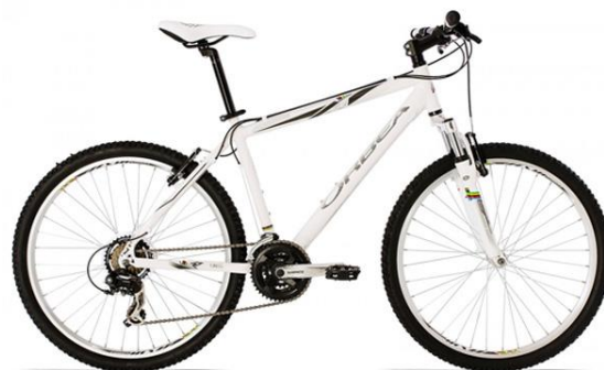
Bicicleta MTB Orbea TUAREG