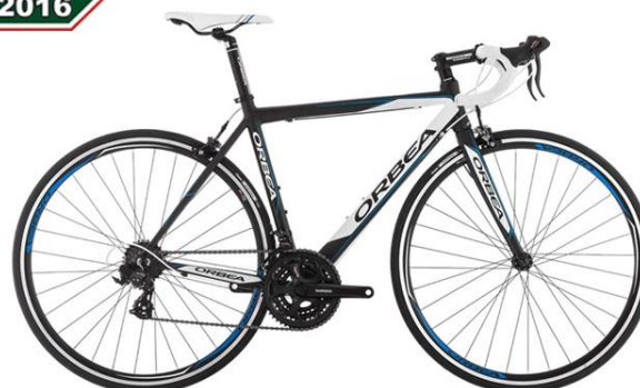
Bicicleta Speed Orbea Aqua H70