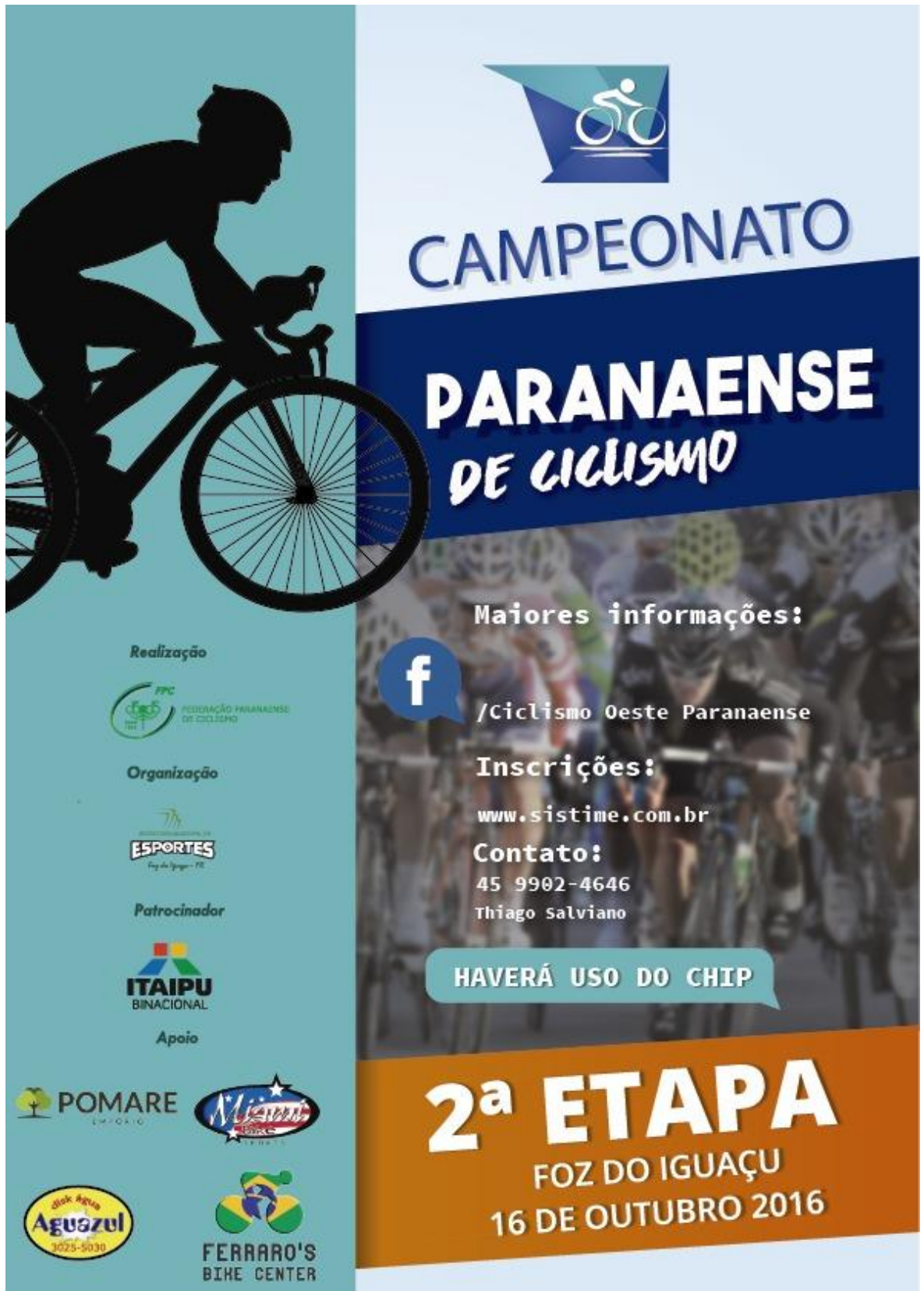
Cartaz do Evento